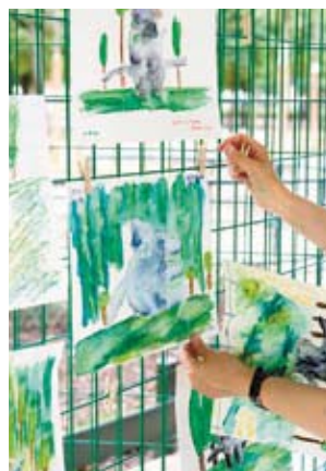
1 et 2. Ateliers en famille au jardin des Tuileries : Le croquis 3 et 4. Atelier enfants : Le Louvre en bulles

Les adhérents de la carte Louvre familles bénéficient d'une réservation prioritaire pour certaines activités signalées dans l'agenda par une pastille ●