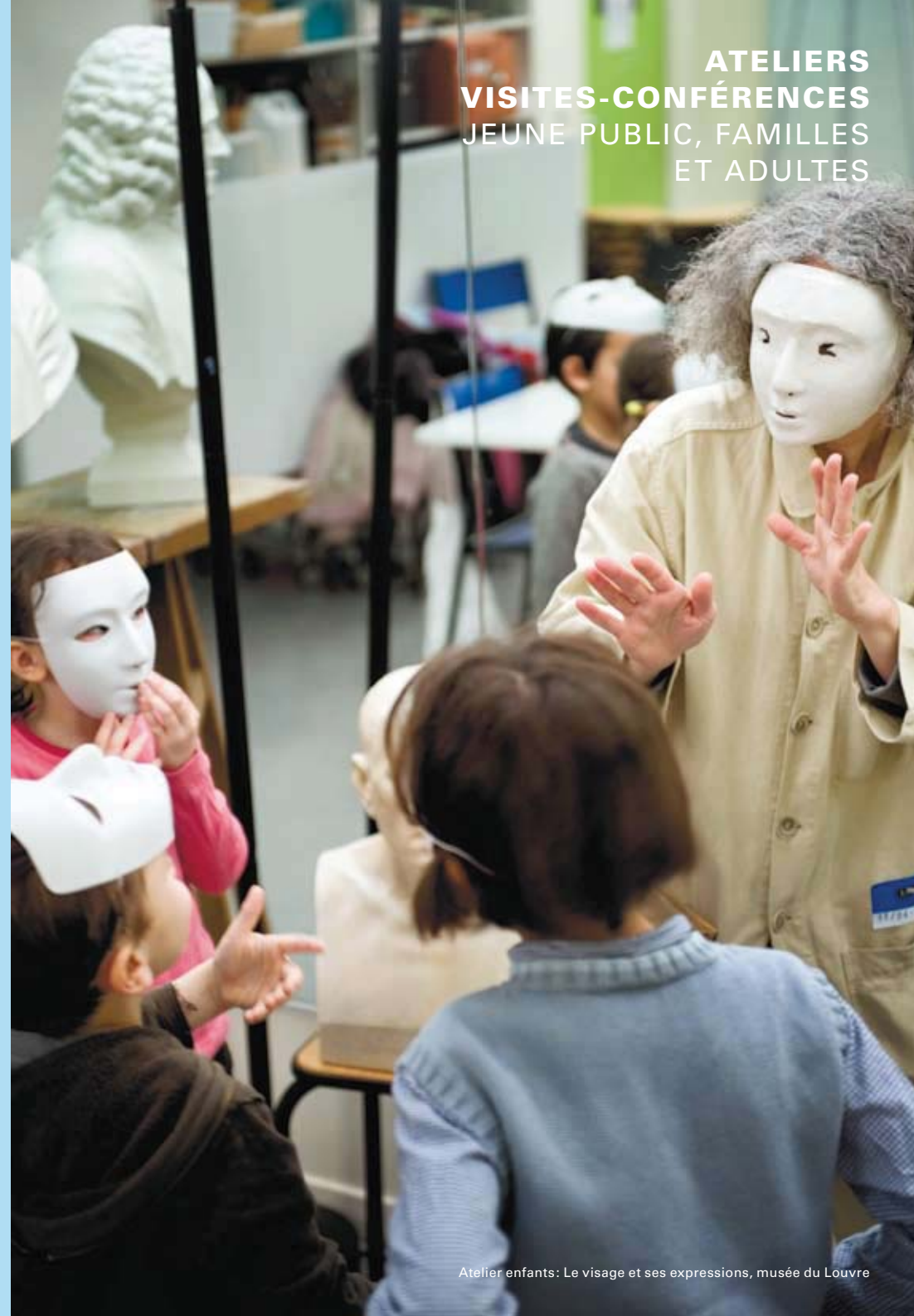
Atelier enfants: Le visage et ses expressions, musée du Louvre

ATELIERS VISITES-CONFÉRENCES JEUNE PUBLIC, FAMILLES ET ADULTES