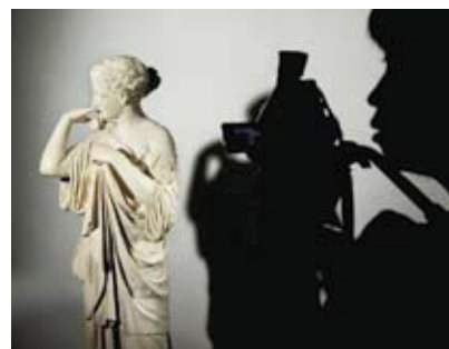
Ateliers adultes 1 et 2. Filmer le Louvre 3. Face aux œuvres / Le croquis

– Ateliers ou visites-conférences (hors cycles) : choisissez l'activité et la date qui vous intéressent. À partir de 14 jours avant cette date, les réservations sont ouvertes par téléphone au 01 40 20 51 77 (paiement par CB) ou sur place à l'accueil des groupes (voir horaires p. 83). Vos billets seront à retirer sur place 30 minutes avant le début de votre activité. Vous pouvez également l'acheter au musée le jour même, si des places sont encore disponibles. – Cycles : réservez dans les points de vente Fnac ou sur fnac.com dès le 12 mars pour avril-juin.