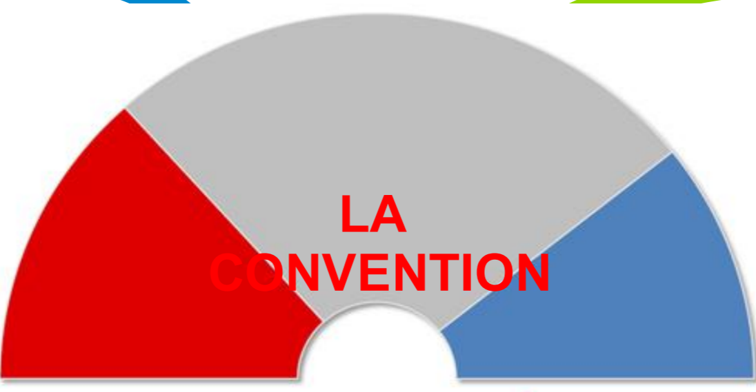
Convention nationale Elections législatives françaises de 1792